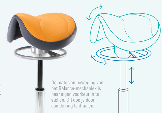
De mate van beweging van het Balance-mechaniek is naar eigen voorkeur in te stellen. Dit doe je door aan de ring te draaien.

De essentie van gezond zitten is dynamisch zitten. Het unieke instelbare Balance-mechaniek van Score Dental zorgt ervoor dat het zadel subtiel met je meebeweegt. Door deze 'micro'-bewegingen van je bekken worden spiergroepen en tussenwervelschijven niet constant even zwaar belast. Je voorkomt daarmee pijnklachten, houdt je werkhouding langer vol en traint de conditie van je rompspieren.