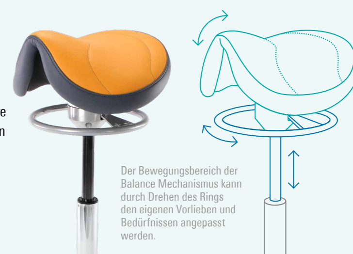
Der Bewegungsbereich der Balance Mechanismus kann durch Drehen des Rings den eigenen Vorlieben und Bedürfnissen angepasst werden.

Gesundes Sitzen ist im Wesentlichen dynamisches Sitzen. Die einzigartige einstellbare Balance Mechanismus von Score Dental sorgt dafür, dass die Sitzfläche auf subtile Weise Ihren Bewegungen folgt. Aufgrund dieser „Mikro“-Bewegungen Ihres Beckens werden Muskelgruppen und Bandscheiben nicht dauerhaft und nur leicht belastet. So wird Schmerzen vorgebeugt, die Aufrechterhaltung der Arbeitsposition unterstützt und die Rumpfmuskulatur gestärkt.