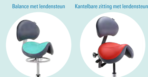
Balance met lendensteun

Op de Score Dental zadelkrukken kan een lendensteun worden geplaatst. De multifunctionele vorm hiervan biedt lichte ondersteuning voor je onderrug bij een actieve werkhouding. Daarnaast kun je er ook lekker tegenaan leunen en strekken voor ontspanning tussendoor.